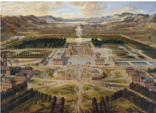
Peinture de Pierre Patel, Versailles peint en 1668 au début du règne de Louis XIV