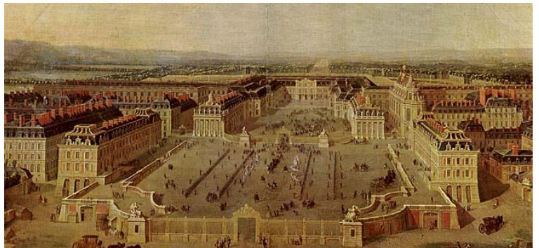
Peinture de Pierre-Denis Martin, Versailles peint en 1722 quelques années après la mort de Louis XIV